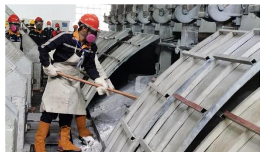
▲ 图为云铝股份青工技术技能大赛现场。